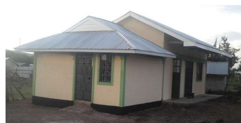
Kjøkken og rektorbolig.