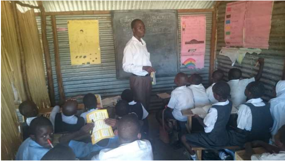
Undervisning i midlertidige lokaler.