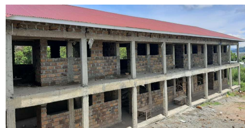
Vår nye skole nærmer seg ferdig.