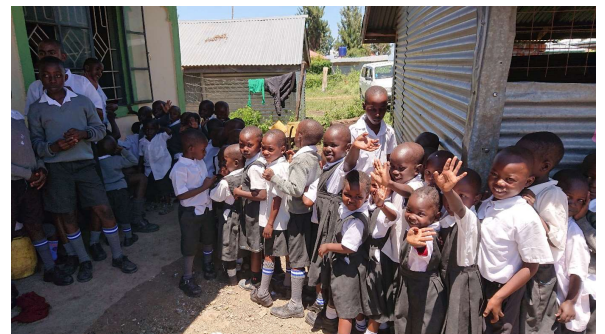
Velkjent matkø slik vi ønsker å se igjen.