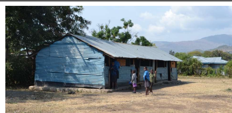
Vårt første skolebygg.

I november drar to fra styret til Mbita for å besøke skolen. Dette blir både spennende og fint. Mye har skjedd på de to og et halvt årene som har gått siden vi var der sist. Vi håper inderlig på at skolen vil være åpen da.