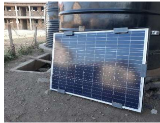
Solceller gir lys på kveldstid.