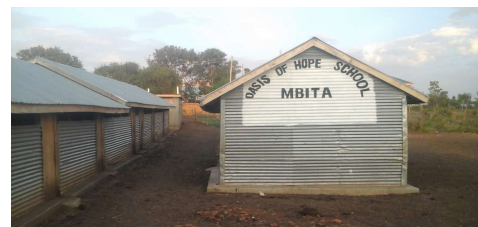
Den midlertidige skolen på egen tomt.