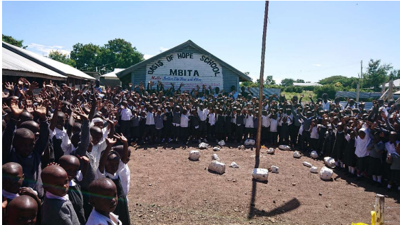
Morgensamling i skolegården.