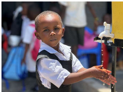
Håndvask er viktig.

Et av tiltakene de lokale myndighetene bidrar med, er det de kaller «deworming» av elevene. Selv om hygiene er viktig, og elevene alltid vasker hender før