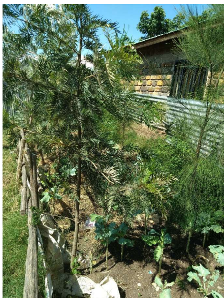
Grønnsakshagen tar form.

I begynnelsen av juli deltok elevene på Oasis of Hope på en idrettsdag for skolene i distriktet. Her vant guttelaget vårt i volleyball, noe som viser at de ikke bare vektlegger teoretiske fag på skolen. Jeg tenker at dette hadde de ikke vært i stand til, hvis de var sultne og slitne av bekymringer.