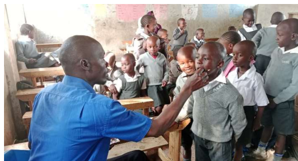
«Deworming» på gang.

de spiser, er det ikke uvanlig at elevene har «mark i magen».