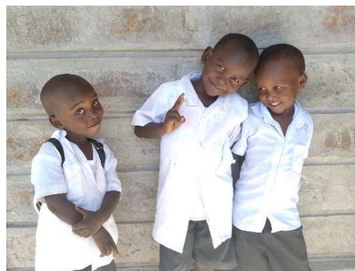
Glade barn på Oasis of Hope-skolen.

Da vi besøkte skolen i februar, fikk vi en krevende beskjed. Lokale myndigheter fylte opp skolen vår med elever og vi innså at det kunne bli svært krevende å gi alle elevene det vi ønsket, nemlig to daglige måltider og god undervisning. I tillegg har nasjonale myndigheter pålagt alle primary schools, som har plass nok, til også å utvide til junior secondary. Dette vil si ett nytt klassetrinn pr. år de neste tre årene, slik at vi også får 7., 8. og 9. klasse hos oss. Men vi har, som dere også har hørt tidligere, et flott og hardtarbeidende styre i Kenya som innså at våre bekymringer var reelle med hensyn til elevantall. De ba om et møte med lokale myndigheter, og der fikk de lovnad om at vi heretter selv skal bestemme hvem som får gå på Oasis of Hope-skolen, slik det har vært tidligere.