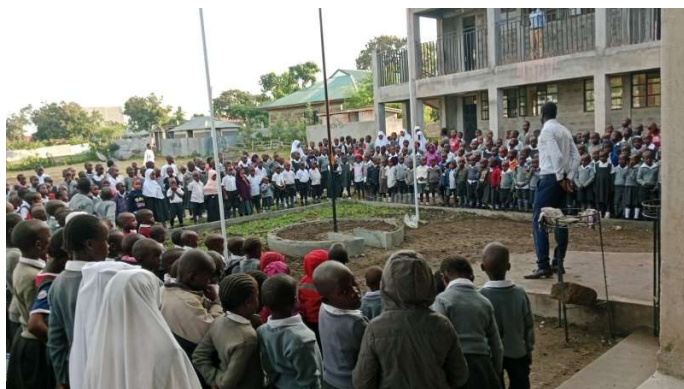
Fredagssamling før helgen.

Skoleåret har nå startet opp tredje termin i Kenya som varer til desember. Det meldes om god og stabil skole drift.