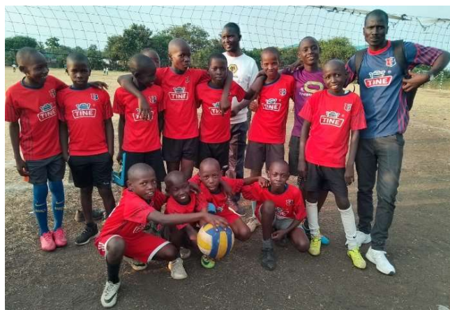
Volleyball-laget i sine velkjente drakter.

Vi ser også at de på skolen lærer å dyrke grønnsaker, som en del av undervisningen. I et land som Kenya, der mange dyrker grønnsaker til eget bruk eller for salg, er dette svært nyttig. Selv om grønnsakhagen på skolen er i minste laget, blir det lagt ned mye viktig arbeid her.